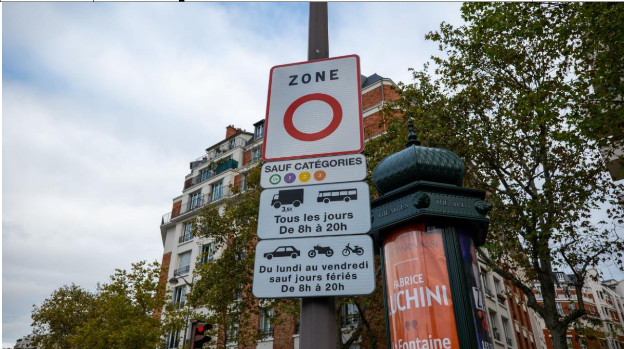
Un panneau d'entrée de ZFE dans Paris.

D'ici le 1er janvier 2025, toutes les agglomérations de plus de 150 000 habitants devront instaurer une Zone à Faibles Émissions mobilité (ZFE-m). L'objectif : baisser les émissions de polluants.