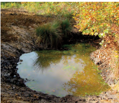
Curage d'une mare

Chaque année la course nature Eco-Trail de Paris dont les coureurs passent en forêts domaniales de Meudon, Versailles et Fausse-Reposes, est partenaire de l'ONF pour la préservation de la biodiversité. Différentes mares et étangs ont été ainsi réhabilités.