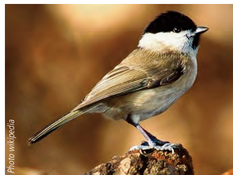
Mésange nonnette Poecile palustris