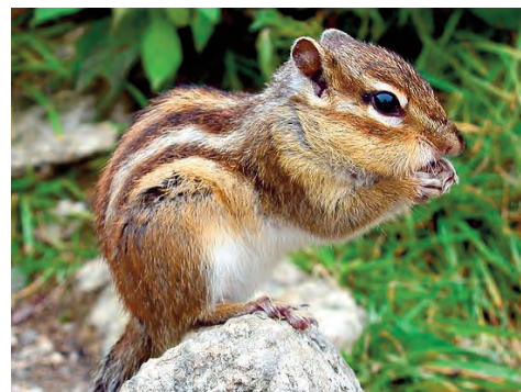
Tamia de Sibérie, Tamias sibiricus

Le silure , poisson omnivore pouvant atteindre 2m, est une espèce bien présente dans nos étangs et fleuves, qui fréquente les zones profondes et se nourrit des autres poissons mais aussi des oiseaux chassés en surface. Les effectifs en baisse de certains oiseaux d'eau dans les étangs de la minière sont observés sans qu'une corrélation avec la présence de silures ait été faite.