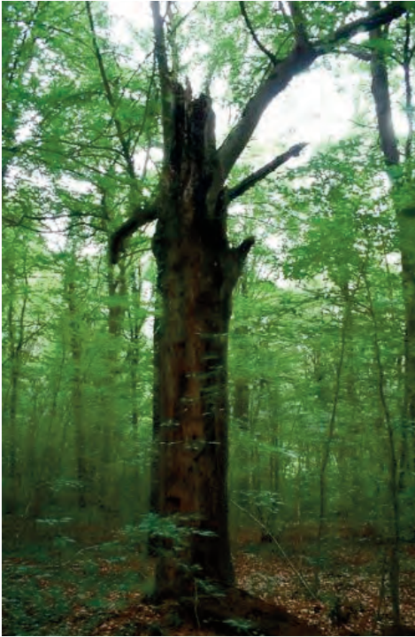
Vieil arbre conservé à des fins écologiques