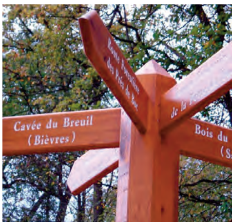
Signalétique en forêt