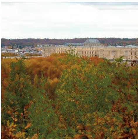
Vue de la forêt

La forêt de Versailles et les jardins du château ont traversé des tempêtes, ouragans, des périodes de froid et de sécheresse et la tempête de 1999 a provoqué la perte de plusieurs milliers d'arbres parfois centenaires. Une politique de repeuplement est menée dans le parc et de rajeunissement dans la forêt domaniale.