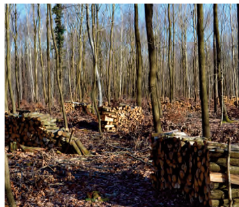
Tas de bois en forêt

Les exploitations font partie de la vie de la forêt. Elles sont nécessaires au renouvellement , à l' amélioration des peuplements ainsi qu'à la sécurité des espaces . Elles permettent également d' alimenter la filière bois .