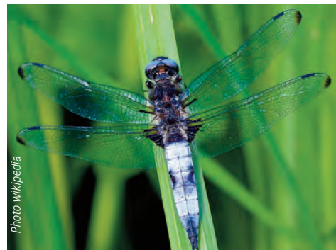
Libellule fauve mâle adulte ( Libellula fulva ) que l'on peut observer dans les marais à végétation abondante de mai à août.

Le chevreuil est largement présent en forêt domaniale de Versailles, ce qui impose sa régulation sous peine de bloquer le rajeunissement de la forêt.