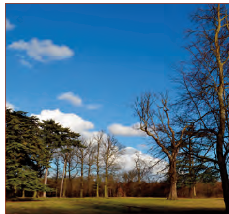
Vue du plateau Saint-Martin

Le chêne sessile, pédonculé et rouge est bien représenté (45 %), le châtaignier (30 %) puis hêtres, frênes, érables, charmes, bouleaux complètent cette forêt presque exclusivement feuillue avec quelques résineux.