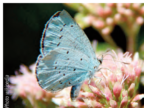
L'azuré des nerpruns, Celastrina argiolus