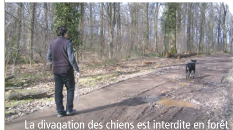
La divagation des chiens est interdite en forêt

Afin de préserver la tranquillité des animaux de la forêt, les chiens doivent toujours rester sous le contrôle direct de leurs maîtres et à proximité.