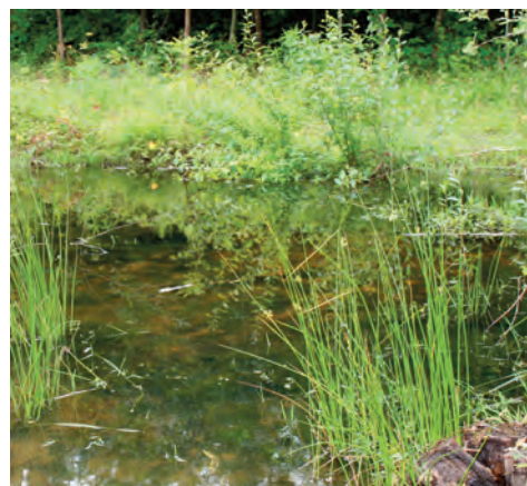
Mare en forêt de Versailles