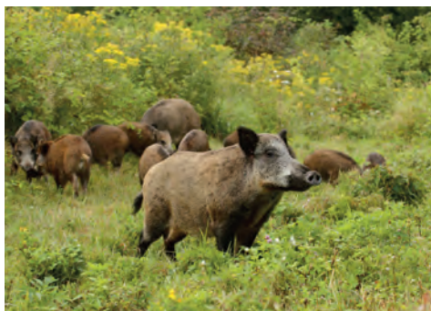
Population de sangliers en forêt