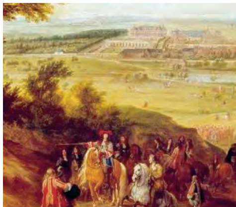
Versailles Roi-Soleil - Vue depuis les hauteurs de Satory 1664 Van der Meuler

Versailles a une histoire unique et une destinée qui témoigne du pouvoir des hommes. D'un petit village, Versailles va devenir une cité royale et une capitale puis, une ville ruinée pendant la révolution, oubliée et aujourd'hui insérée dans l'agglomération parisienne. Les villages alentours se sont réunis à travers leurs infrastructures. La forêt dense du Moyen-Âge dans laquelle les rois et les paysans y chassaient les loups est aujourd'hui morcelée mais d'une importance historique, écologique et sociale reconnue.