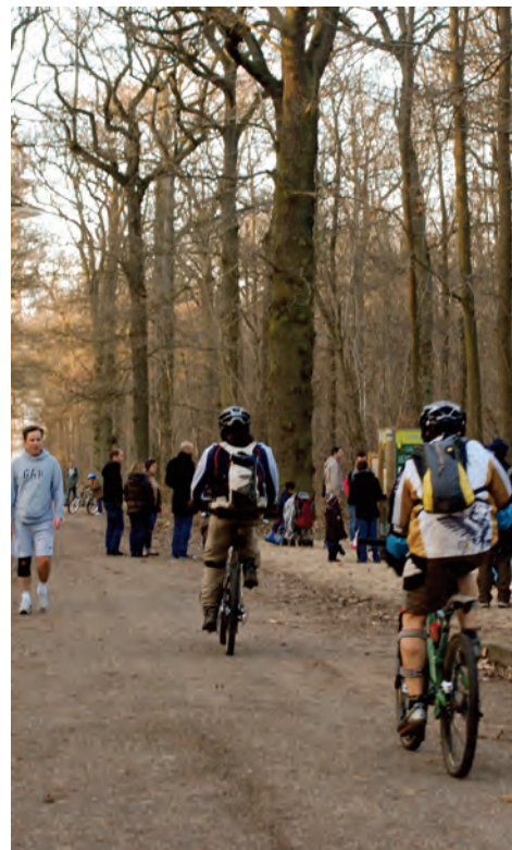
Accueil du public en forêt périurbaine