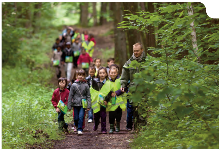
Animation en forêt

L'ONF a pour mission d'accueillir ce large public et doit également canaliser les populations afin de préserver l'équilibre fragile de la forêt.