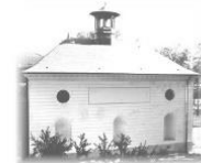
Versailles, janvier 2021

AS.RI.EU.PE. Association des Riverains Etats-Unis Pershing 138, avenue des Etats-Unis 78000 Versailles Email : asrieupe@gmail.com Site internet : www.asrieupe.org