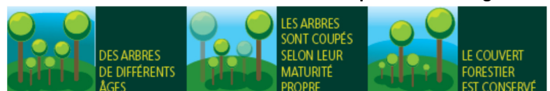
Illustration d'une coupe en futaie irrégulière

L'ONF a annoncé le changement de gestion pour les forêts périurbaines, avec le passage à une sylviculture en futaie irrégulière . Ce mode de gestion qui consiste à couper progressivement les arbres, permet de maintenir le paysage forestier lors des coupes.