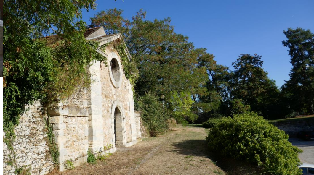
Bassin de Picardie