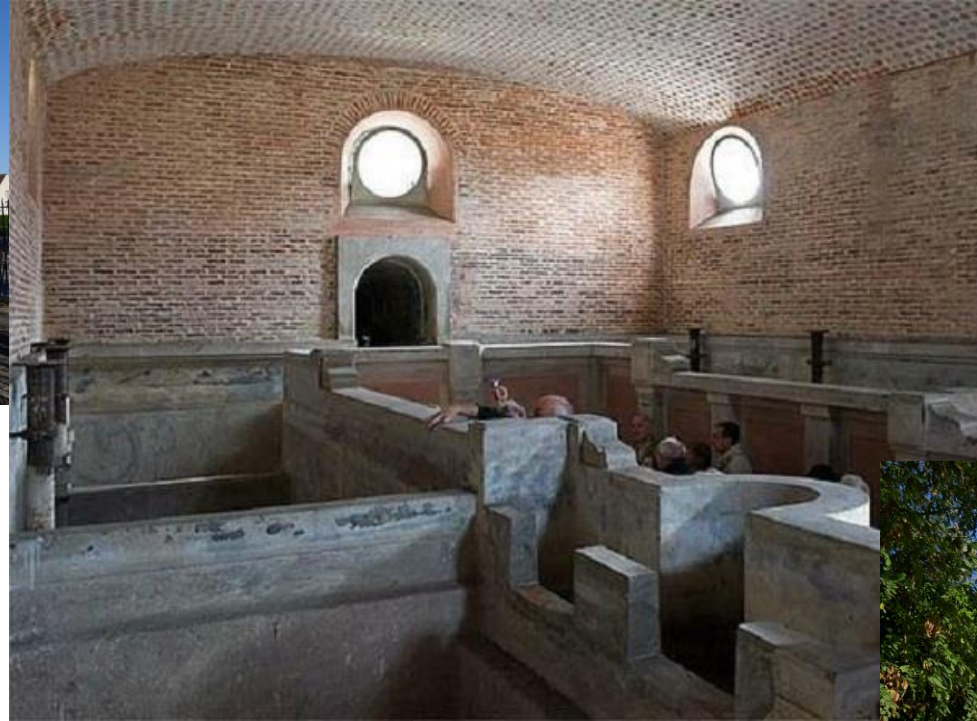
Pavillon des filtres