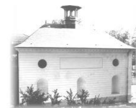
Versailles, novembre 2019

AS.RI.EU.PE. Association des Riverains Etats-Unis Pershing 138, avenue des Etats-Unis 78000 Versailles Email : asrieupe@gmail.com www.asrieupe.org