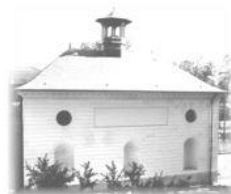
Versailles, juin 2019

AS.RI.EU.PE. Association des Riverains Etats-Unis Pershing 138, avenue des Etats-Unis 78 000 Versailles www.asrieupe.org