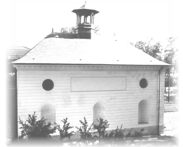
Versailles, juin 2019

Association des Riverains Etats-Unis Pershing 138, avenue des Etats-Unis 78 000 Versailles www.asrieupe.org