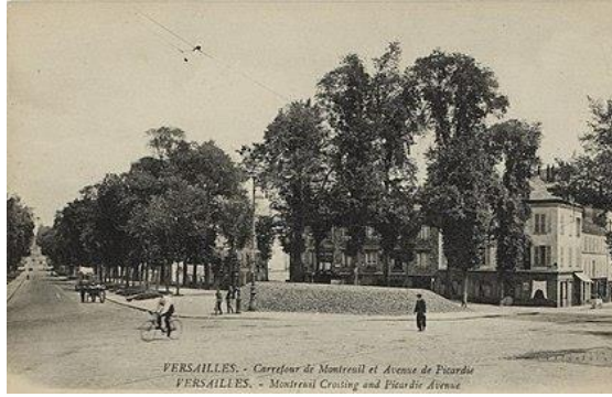
Carrefour de la rue de Montreuil et de l'avenue des États-Unis au début du XX e siècle.