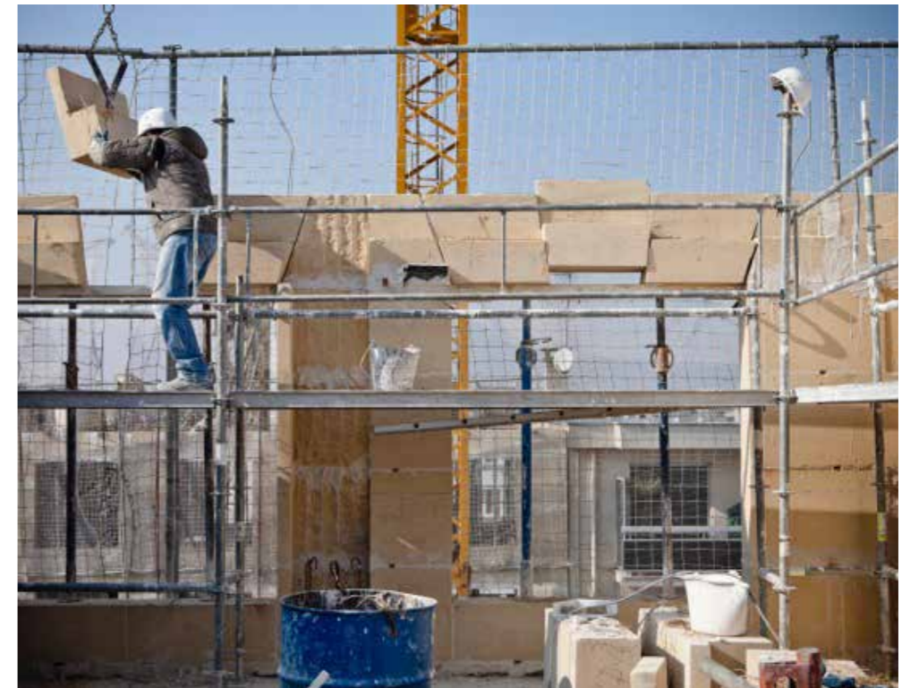
Pose de pierre de taille

(* ) 28 logements en accession à la propriété, 15 logements sociaux et 6 logements locatifs intermédiaires sont pourvus d'espaces extérieurs (loggia ou terrasse).