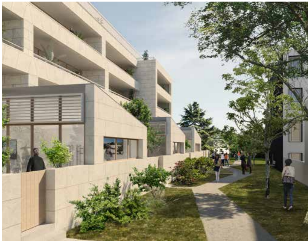
Au sud-est du bâtiment A, vue des jardinets privés, clos par des murets en pierre de taille, et du jardin linéaire ouvert au public.

E&L Promotion participe au financement de ces aménagements par le biais d'un projet urbain partenarial conclu avec la Ville de Versailles et rétrocèdera le mail à l'euro symbolique, à l'issue des travaux.