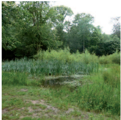
Mare en forêt de Marly

Plusieurs plans de gestion des zones humides et des mares ont été mis en place (forêts de l'Isle-Adam, Montmorency et Marly). La gestion des Réserves biologiques dirigées en forêt de Rambouillet est entièrement concertée.