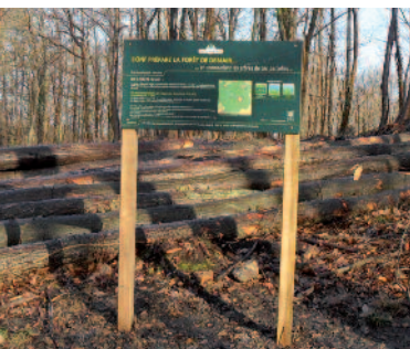
Panneau d'information d'une coupe de bois

Les forêts domaniales d'Île-de-France ne sont ni des grands jardins ni des parcs urbains. Pour préserver leur identité et leur pérennité, il est nécessaire de récolter des arbres et de produire du bois, qui est une des trois fonctions d'une forêt.