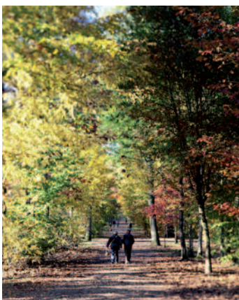
Forêt de Montmorency

Pour autant, la propreté reste le 1 er poste de dépense de l'accueil du public.