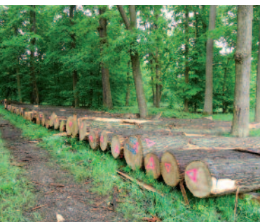
Billes de châtaigniers