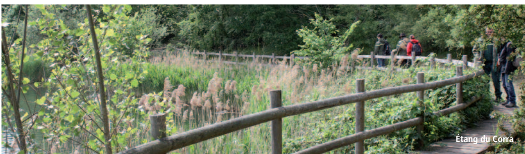
Étang du Corra