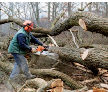
Coupe de bois