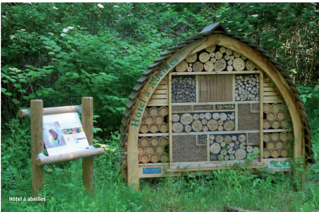
Hôtel à abeilles