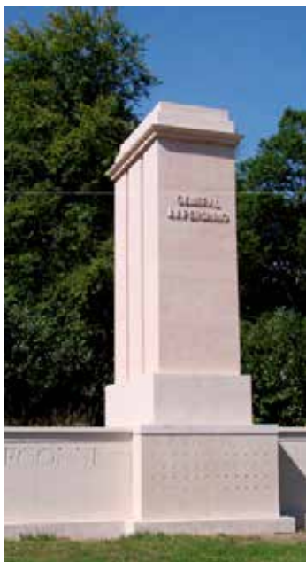
État en 2002