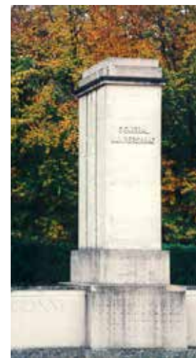
État en 1997

Un deuxième Comité national, présidé par Édouard Herriot, Président de la Chambre des députés, est constitué en 1951 pour réunir les fonds nécessaires à l'achèvement du monument, à savoir, la réalisation des deux statues en bronze. En dépit de tous les efforts déployés dès lors pour obtenir des fonds (projet de loi en 1952, appel aux villes de France, démarches en Amérique, projet de timbre, quêtes publiques, fêtes de nuit, proposition de loi en 1955, et même une intervention du Premier ministre en 1961), le monument ne sera pas achevé. L'échec s'explique par l'absence de crédits « à l'heure où il faut construire des logements » mais surtout faute d'accord sur le déplacement de la statue de La Fayette se trouvant dans la cour Napoléon du Louvre.