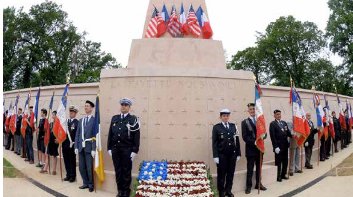
Inauguration des socles rénovés le 8 mai 2011