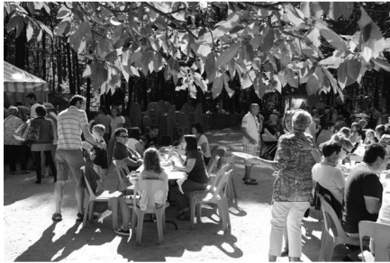
Autour du barbecue offert par l'AS.RI.EU.P.E. et des salades apportées par les participants, les discussions s'engagent entre voisins.