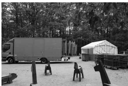
La contribution de la mairie