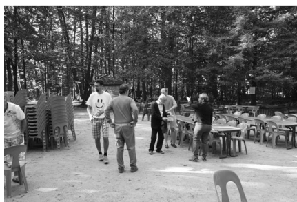
Les organisateurs installent