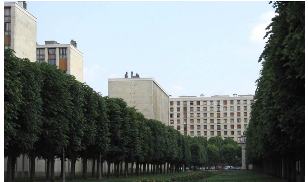
Le Grand Mail de la résidence du Parc- Meudon (92)

Médiathèque, place centrale - avenue du Général de Gaulle, 92360 Meudon-la-Forêt