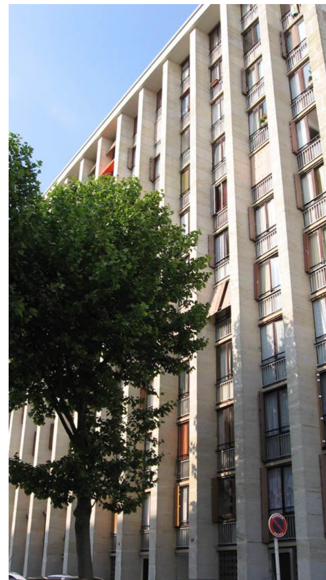
«D'immenses piles de pierre constituaient les façades...» Mémoire d'un architecte p 362, F. Pouillon